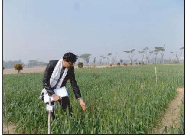
গমের ডিইউএস টেস্ট এর ডাটা সংগ্রহ