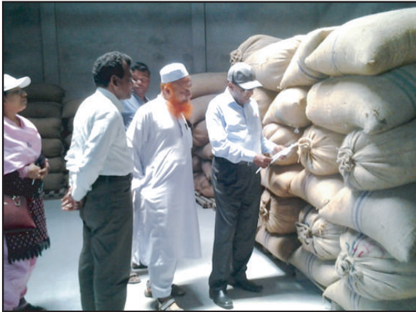
পরিচালক বীজ প্রত্যয়ন এজেন্সী কর্তৃক প্রত্যায়িত বীজের লট পরিদর্শন