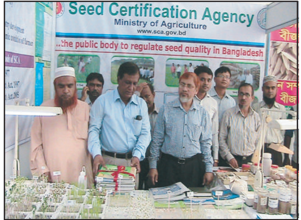
জাতীয় কৃষি প্রযুক্তি মেলা/২০১৫ তে বীজ প্রত্যয়ন এজেন্সীর স্টল