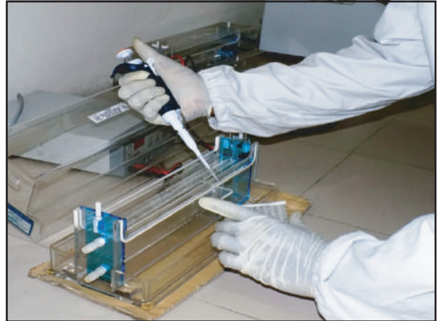
জাত পরীক্ষাগারে ডিএনএ ফিঙ্গার প্রিন্টিং কার্যক্রম