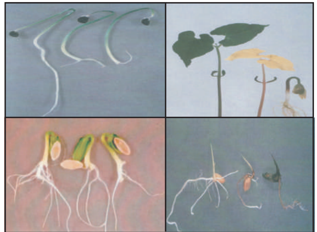
অঙ্কুরোদগম পরীক্ষায় স্বাভাবিক ও অস্বাভাবিক চারার মূল্যায়ন