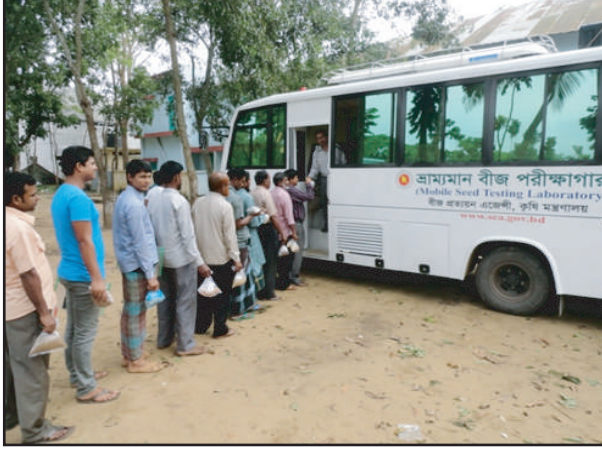
ভ্রাম্যমান বীজ পরীক্ষাগারের মাধ্যমে কৃষকের দোরগোড়ায় বীজ পরীক্ষা সেবা