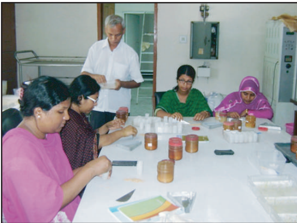
অঙ্কুরোদগম পরীক্ষা শাখার কার্যক্রম