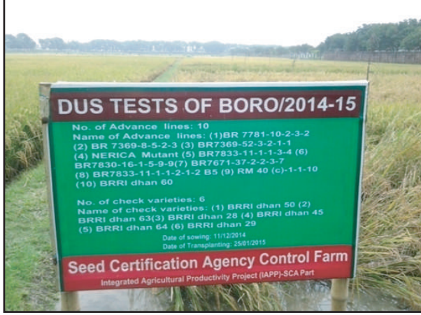
বীজ প্রত্যয়ন এজেন্সী, গাজীপুরের কন্ট্রোল ফার্মে ধানের ডিইউএস টেস্ট পরিচালনা