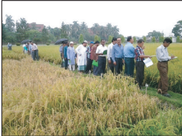
বীজ প্রত্যয়ন এজেন্সী, গাজীপুরের কন্ট্রোল ফার্মে ধানের প্রি-পোস্ট কন্ট্রোল প্রো-আউট টেস্ট বিষয়ক মাঠ দিবস