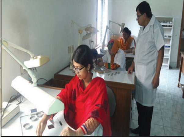
বীজ বিশুদ্ধতা পরীক্ষা শাখার কার্যক্রম