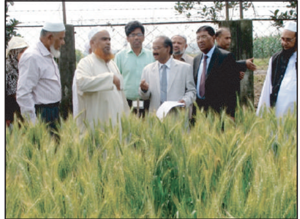
গম ফসলের মাঠ দিবসে ভাইস চ্যান্সেলর, বঙ্গবন্ধু শেখ মুজিবুর রহমান কৃষি বিশ্ববিদ্যালয়; পরিচালক, বীজ প্রত্যয়ন এজেন্সী এবং পরিচালক (গবেষণা), বাংলাদেশ কৃষি গবেষণা ইন্সটিটিউটসহ অন্যান্য কর্মকর্তাবৃন্দের মাঠ পরিদর্শন