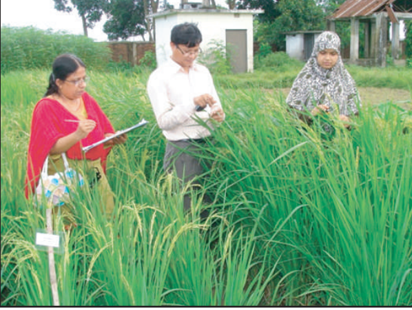
আউশ ধানের ডিইউএস টেস্ট এর ডাটা সংগ্রহ