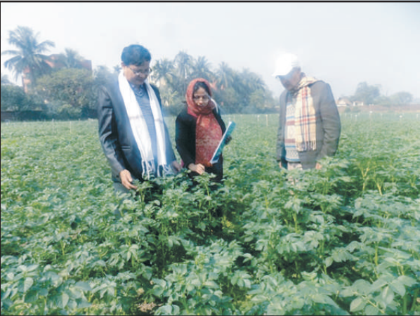
আলুর ডিইউএস টেস্ট এর ডাটা সংগ্রহ