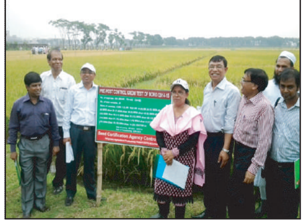
বীজ প্রত্যয়ন এজেন্সী, গাজীপুরের কন্ট্রোল ফার্মে ধানের প্রি-পোস্ট কন্ট্রোল ও প্রো-আউট টেস্টের মাঠ দিবসের অনুষ্ঠান