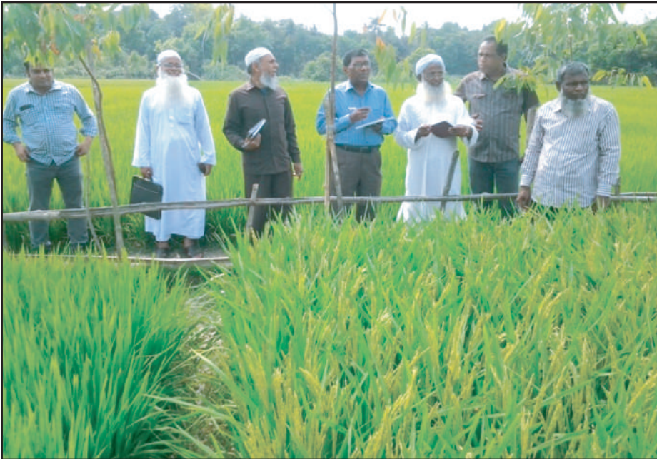
ধান বীজ ফসলের মাঠ পরিদর্শনে পরিচালক ও অন্যান্য কর্মকর্তাবৃন্দ