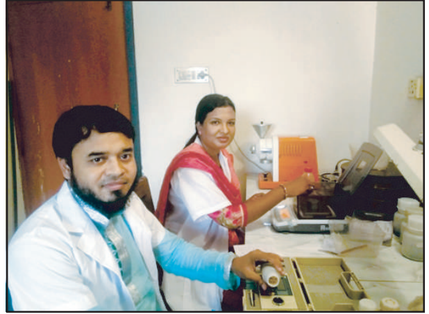
বীজের আর্দ্রতা পরীক্ষা শাখার কার্যক্রম