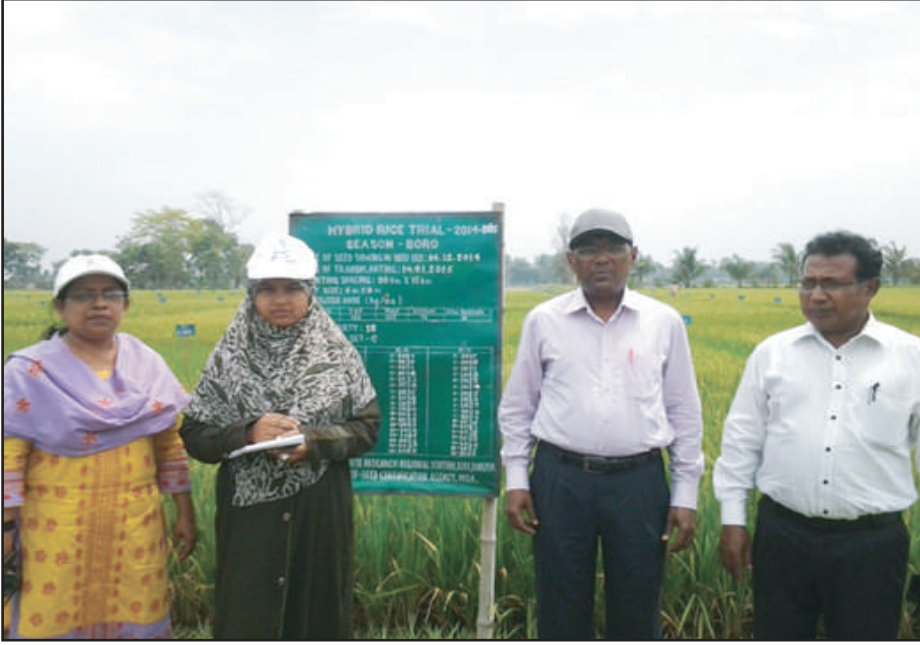
রংপুর অঞ্চলে স্থাপিত হাইব্রিড ধানের ট্রায়াল পরিদর্শনে পরিচালক, বীজ প্রত্যয়ন এজেন্সী